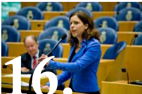
Eerste oogst: impact in Den Haag