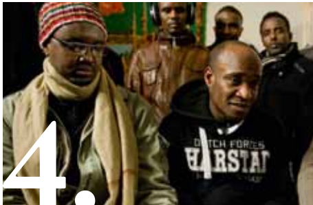
Asielbeleid: "honden zijn beter af"