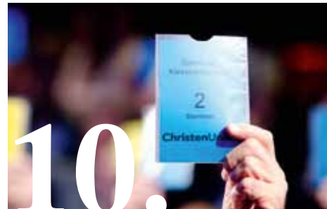
Congres: Op weg naar partijvernieuwing