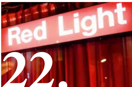
Mensenhandel en prostitutie: "Zolang de vraag er is, zullen vrouwen aangevoerd worden"